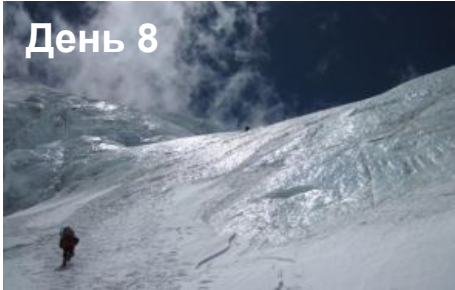
Акклиматизация в Базовом Лагере Эверест (5200м).