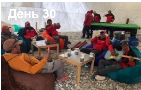
День 43 Отъезд из Лхасы.