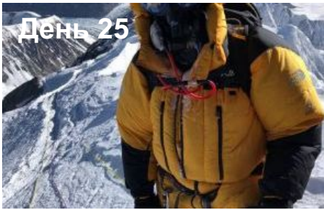
День 31 Переход до лагеря (8300м)