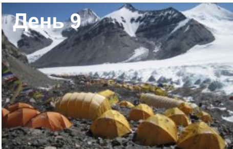
Переход в Мидл Кемп (5800м)