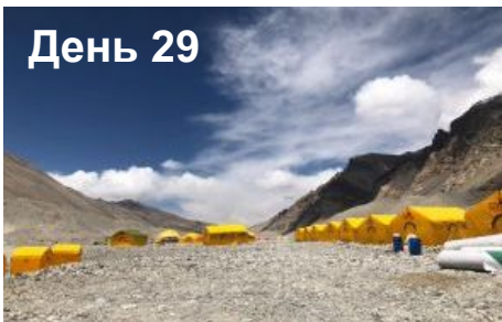
День 42 Ранний выезд из БЛ. Ночь в отеле в Лхасе.