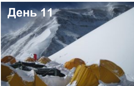
День 14. Переход в Передовой Базовый Лагерь (6400м).