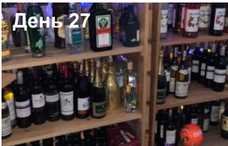
День 33-39 Резервные дни