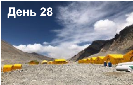
День 40-41 Спуск в Базовый лагерь (5200м). Ночь в БЛ.