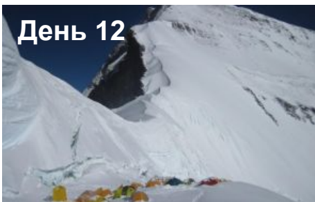
Акклиматизация в ABC (6400м)