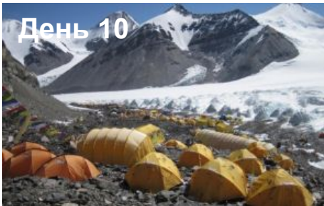
Переход в ABC (6400м)