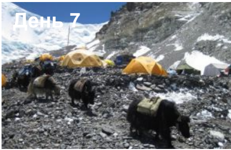
Акклиматизация в Базовом Лагере Эверест (5200м).