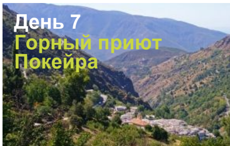
День 7 Горный приют Покейра

После завтрака переезжаем в Альпужаррас, на южные склоны массива Сьерра Невада, где останавливаемся в деревне долины реки Покейра и выходим на трекинг по долине. Высота нашей базы 1400 м над уровнем моря. Общий ужин в отеле и подготовка к восхождению. Лас-Альпужаррас – это область, раскинувшаяся под южными склонами Сьерра-Невады, в долине реки Гуадальфео. В живописные горные деревушки стекаются любители спокойного отдыха на природе и пеших походов. Здесь можно увидеть аутентичные дома с плоскими крышами, нагруженных поклажей и бредущих по узким тропинкам мулов, и, конечно, покрытые снегом горные пики (зимой).