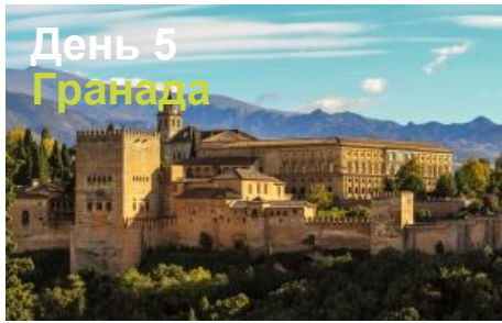
День 5 Гранада

подвергались эрозии много десятков, а может и сотен миллионов лет. Пейзажи парка являются ярким примером карстового рельефа.