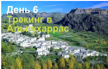
День 6 Трекинг в Альпужаррас

Гранада располагается в удивительной местности, у подножия северо-восточного склона Сьерра Невады. Гранада стоит на трех холмах, спускающихся в долину, где мерно течет река Ханиль и ее приток Дарро. Согласно легенде, именно эти холмы с виду напоминающие раскрытый гранат, дали городу его название – Гранада. Только в этом городе удивительным образом гармонично сочетаются необыкновенной красоты пейзажи, здания старинной архитектуры и белые кварталы новых застроек. Гранада по праву считается одним из красивейших городов мира. Ее архитектура, история и традиции в сочетании с необычным природным ландшафтом каждый год привлекают сотни тысяч туристов.